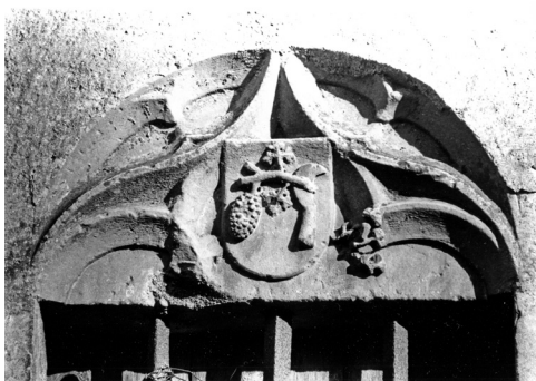
Le linteau avec l'écusson de vigneron. Collection François Courtade.

La dénomination se passe d'explications. Il faut remarquer sur une maison en début de rue, un très beau linteau arborant un écusson de vigneron.